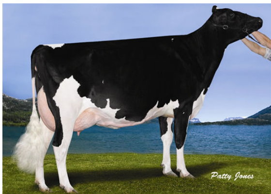
VALLEYVILLE DOLMAN MISSY